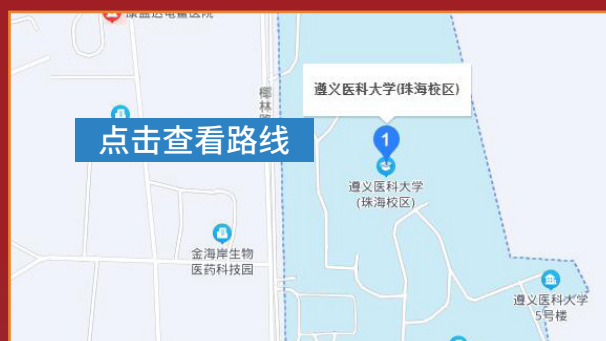
遵义医科大学珠海校区交通图