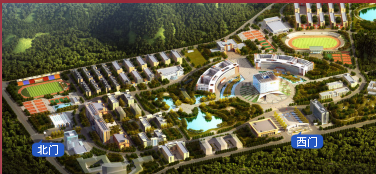
遵义医科大学新蒲校区校内图

学校地址：贵州省遵义市新蒲新区学府西路6号（新蒲校区） 广东省珠海市金湾区金海岸（珠海校区）