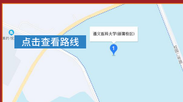
遵义医科大学新蒲校区交通图